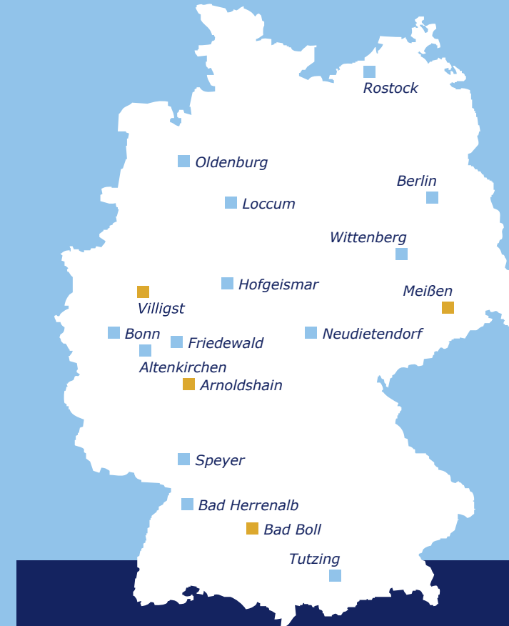
■ Am Projekt beteiligte Akademien

Evangelische Sozialakademie Friedewald Schlossstr. 2 • 57520 Friedewald T.: 02743/9236-0 ev.sozialakademie@t-online.de www.ev-sozialakademie.de