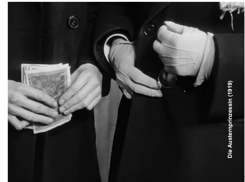
Die Austerprinzessin (1919)