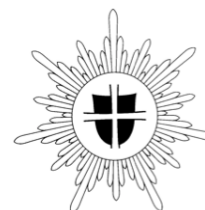
Polizeipfarramt der EKHN

Tel.: 06084-944-0 Fax: 06084-944-194 E-Mail: office@martin-niemoeller-haus.de