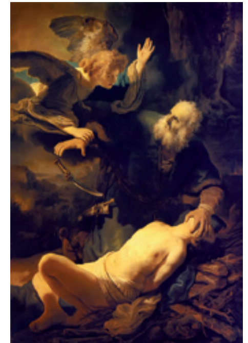
Abraham and Isaac, Rembrandt van Rijn, 1634

7. bis 9. Mai 2010 (Fr. – So.) Tagungsnummer: 107171