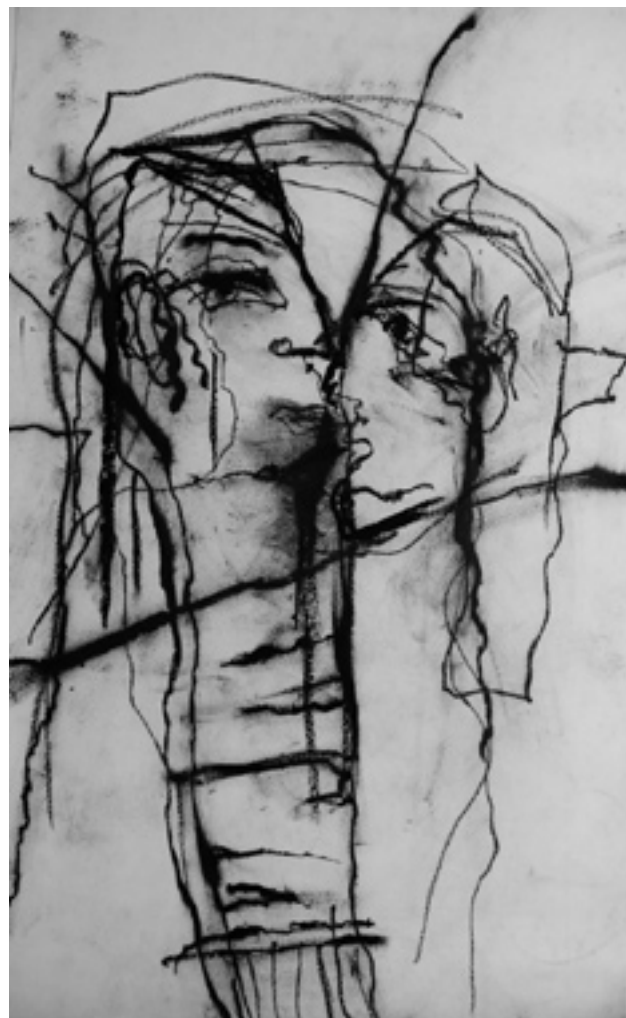
aus einer Reihe Celan zu „Gespräch im Gebirg“, 2001, Ölkreide, Papier, 30 x 70 cm