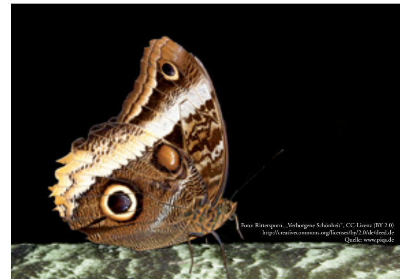
Foto: Rittersporn, „Verborgene Schönheit“, CC-Lizenz (BY 2.0) http://creativecommons.org/licenses/by/2.0/de/deed.de Quelle: www.piqs.de

1. bis 2. Mai 2010 (Sa.-So.) Tagungsnummer: 108242