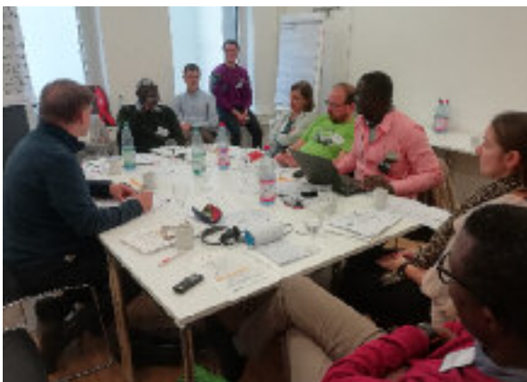
Workshop II: Ressourcenkonflikte im Kontext von Klimawandel und Landgrabbing.

Olaf Bernau ist Soziologe. Er ist Journalist und gehört zum Koordinierungskreis des transnationalen Netzwerks Afrique-Europe-Interact. In diesem Zusammenhang hält er sich regelmäßig im Sahel auf, insbesondere in Mali.