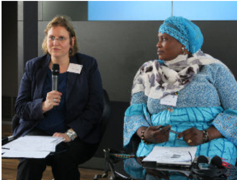
Titelbild: Kundgebung der bäuerlichen Basisgewerkschaft COPON im Office du Niger, Mali 2017.